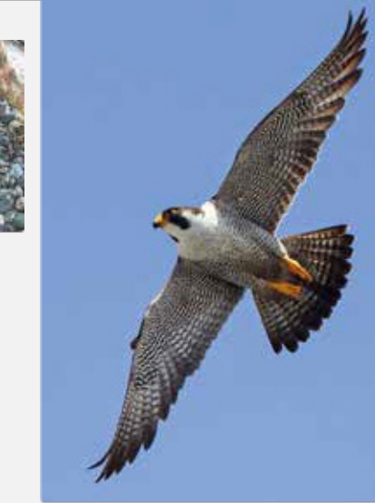
雄親「きららⅢ」の美しい飛翔

この場所でハヤブサが繁殖を続けている理由は、まず、この場所が子育てをするのにとっても安全な場所であることが考えられる。海岸沿いや山中の岩場は風雨にさらされ、ヘビや野生の獣などに捕食される危険が多いが、ホテルであれば人間が邪魔しない限り、巣立ちまではほぼ順調に子育てが進む。