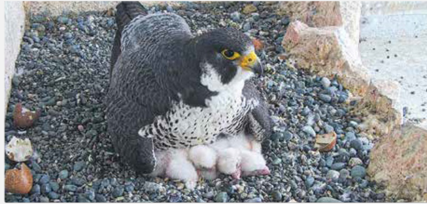
阪神高速道路 PA に隣接するホテルの高層階のベランダが、ハヤブサの営巣場所。雌親「さら」に守られて眠りにつく雛たち。本記事の営巣写真はリモートカメラで撮影した

実は、ホテルの高層階のベランダから巣立っていくハヤブサの行く先には高速道路のパーキングエリアや本線が隣接しており、巣立ち直後に車に轢かれる危険があった。そこで、巣立ち幼鳥たちを見守り、可能なら救助したいという目的で、地元のハヤブサファンやホテルの従業員、日本野鳥の会