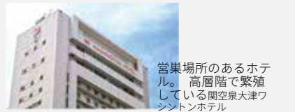
営巣場所のあるホテル。高層階で繁殖している関空泉大津ワシントンホテル