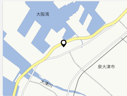
関空泉大津ワシントンホテルの位置。南に関西国際空港がある