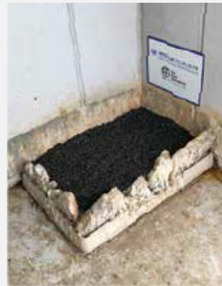
初めはハトの糞の山だったところに、石を積み、砂利を敷いて作った営巣場所。雛たちの糞や食べかすなどで汚れた巣を清掃するサポートも行なっている

大阪支部の有志などで泉大津ハヤブサ・サポート倶楽部(以下、サポート倶楽部)を発足。営巣場所に「見守りカメラ」と名付けたリモートカメラを設置し、産卵、抱卵、孵化、巣内での雛の成長過程などを観察し、見守りカメラの映像をホームページで一般に公開する活動を始めた。幸いにも、2006 年の繁殖も順調に進み、6 月までに 4 羽の雛が巣立っていった。